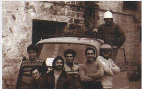
Dicembre 1975, partenza per Lanzo (Martina Franca TA)